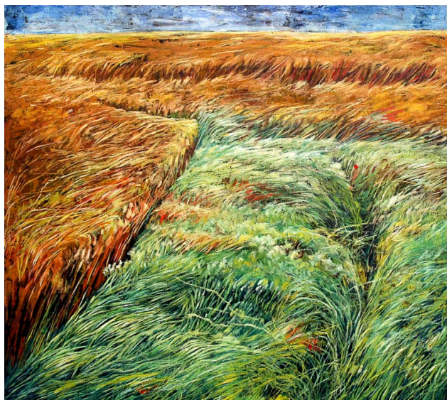
Grandes Herbes, huile sur isorel (Donation Pollet - Six-Fours-les-Plages)

Pour la donation, la Maison du Cygne a choisi seize œuvres « avec le souci de retracer les différentes périodes relatives au parcours de l'artiste défunt », précise Dominique Baviera, le directeur, lors de l'inauguration de la salle Claude-Henry Pollet. « Les pièces seront en permanence exposées ici (à la Maison du Cygne), poursuit le directeur, ou en d'autres lieux communaux, et feront l'objet d'une présentation auprès d'un large public. Elles pourront également être mises à