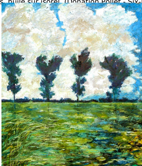
Vert émeraude marais, huile sur isorel, 88*94 cm (Donation Pollet - La Seyne-sur-Mer)